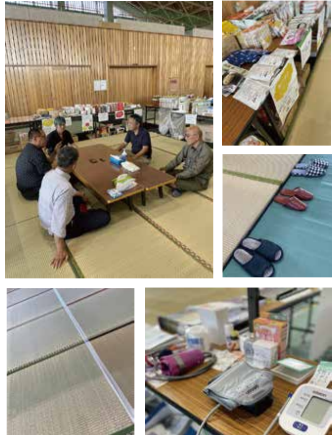
(1) 体育館全面に敷かれた畳の上に段ボールハウス。(2) 「おしゃべり広場」と看板がある場所で座談会をさせていただいた (3) 食べ物やお菓子などがずらり。わかりやすく栄養グループ別に。(4) 入り口から畳にあがるところ。スリッパがきれいに並んでいました (5) 清潔に使うため、畳の間からゴミやほこりが落ちないようにテープで固定。(6) 血圧計などの医療品も見えやすいところに並べてありました。