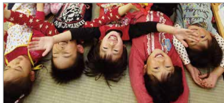
熊本地震時、避難所で遊ぶ子供たち。